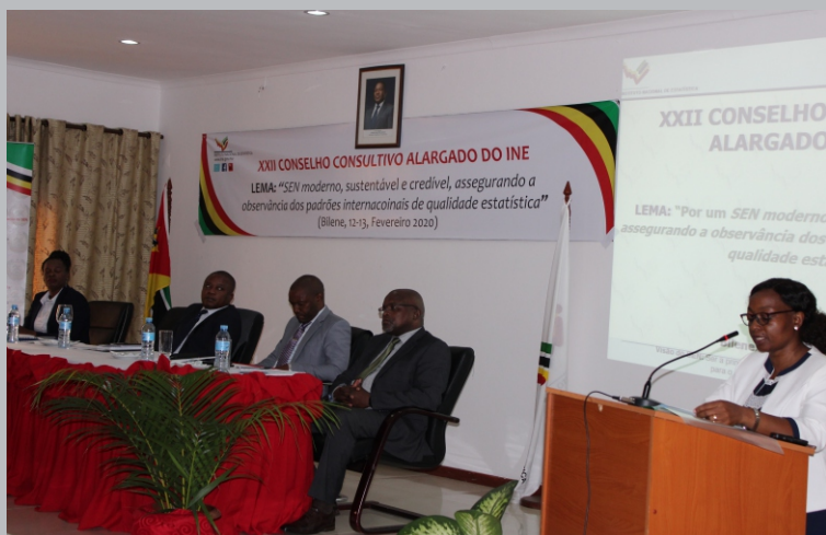
S.Excia Presidente do INE dirigindo-se aos participantes

A agenda do encontro incluía ainda a avaliação do desempenho anual do Sistema Estatístico Nacional, a apreciação das principais linhas de actividades que integram o Plano e Orçamento para o corrente ano de 2020, a apresentação da Estratégia Nacional de Disseminação dos Indicadores dos Objectivos de Desenvolvimento Sustentável e dos resultados do Inquérito Especial do Cajú, bem como a apreciação da informação sobre as próximas grandes operações Estatísticas, nomeadamente o Inquérito aos Orçamentos Familiares (já em curso), Censo Agropecuário e de Pescas, Inquérito Demográfico e de Saúde, o Inquérito sobre Acesso a Energia Sustentável e a Plataforma de Acesso ao Emprego.